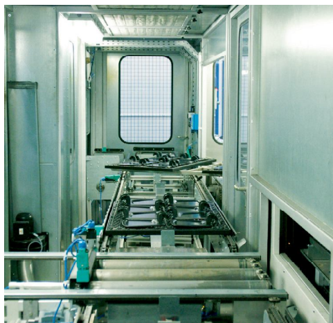
Der Kettenförderer – im Hintergrund die Drehstation vor der Lackierkabine, im Vordergrund der Einlass zum Turmtrockner.

Nach Prüfung mehrerer Angebote und auch aufgrund der guten Erfahrungen, die KTS